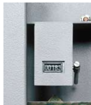
Le compteur et le scellé du foncet (en option): de précieux indices pour savoir si l'armoire a été ouverte en votre absence.